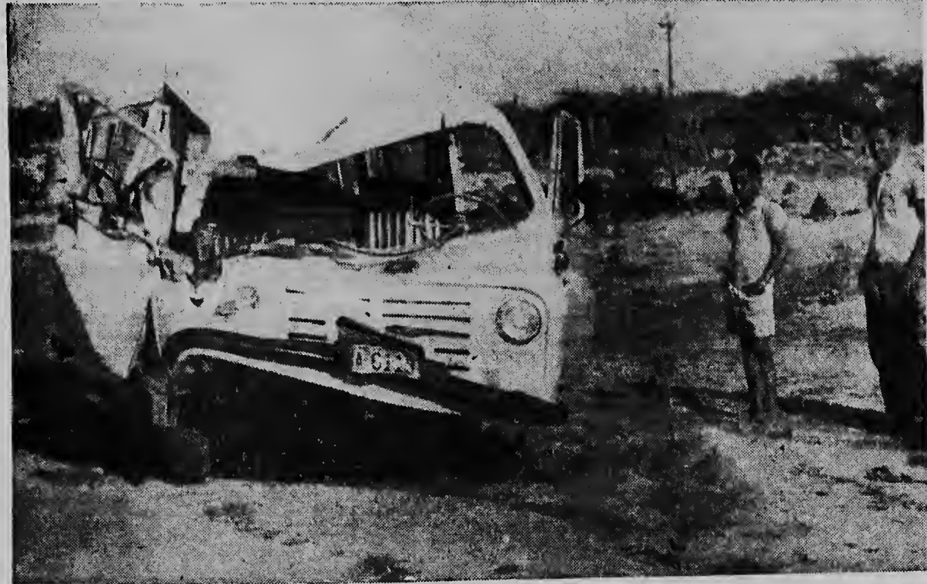
Asina aki e stationwagon A-6118 a keda destrui despues di a pega patras dje truck A-6975. E truck no a hania ningun daño material, pero manera por mira e bus a keda completamente destrui parti dilanti.